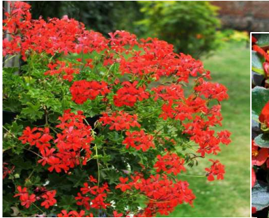
Geranium (Pélargonium) Lierre Impérial (G)