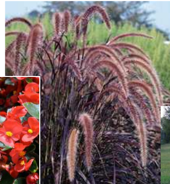
Pennisetum Rubrum (P)