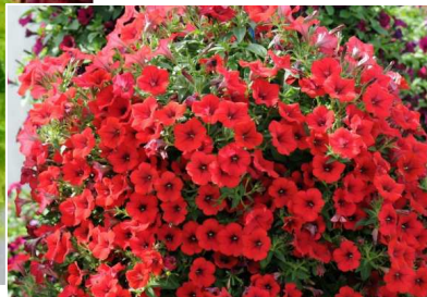
Surfinia Dark Red (S)