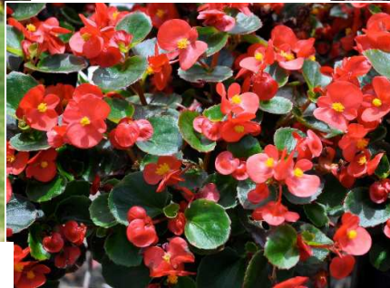
Bégonia rouge (B)