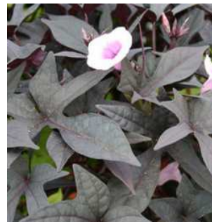
Ipomée Black (I)

Le nombre de plantes varie en fonction de la taille de vos jardinières, les plantes proposées sont des plantes à développement très dense pour des jardinières de 50 cm et inférieur, 3 plantes suffisent, voici quelques propositions d'arrangements :